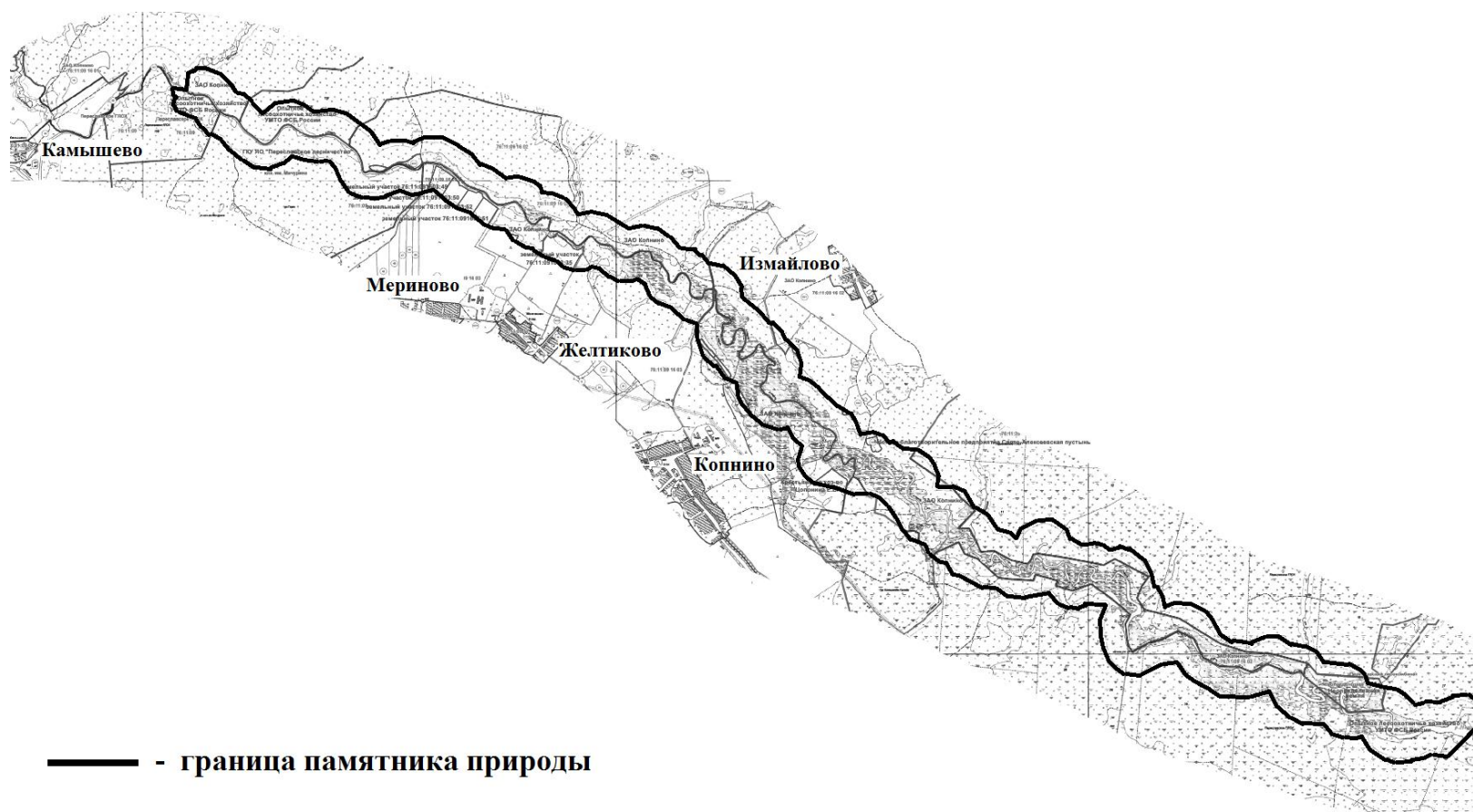
СХЕМА границ памятника природы «Долина р. Нерли Волжской»